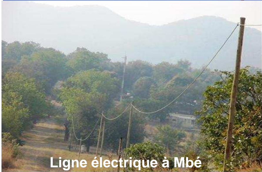
Ligne électrique à Mbé