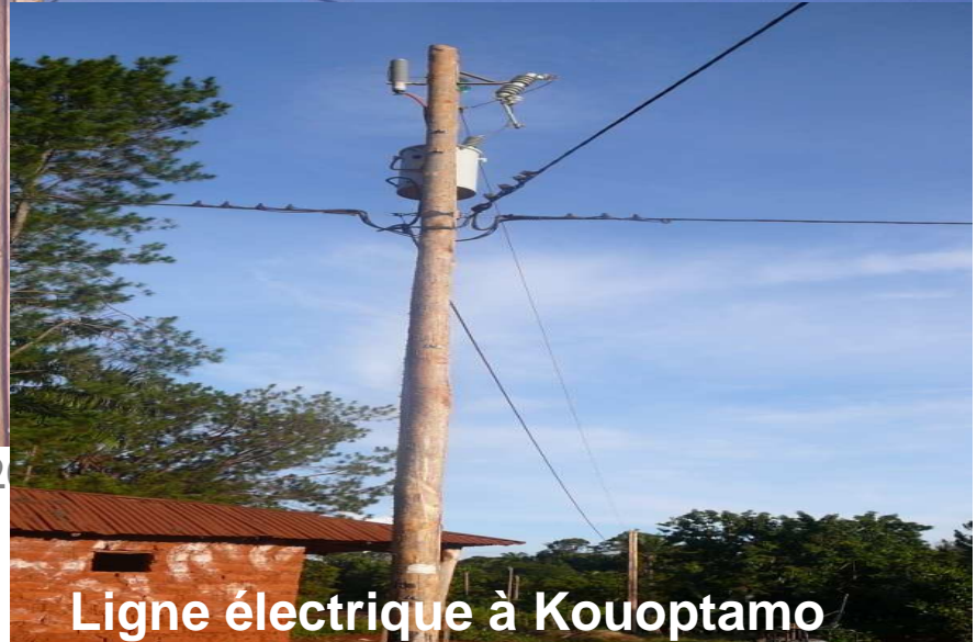
Ligne électrique à Kouoptamo